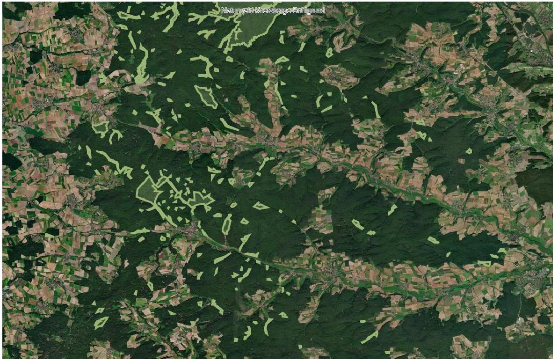
Abb. 3: Naturwaldflächen und Naturwaldreservate im Forstbetrieb Ebrach: Bayerische Landesanstalt für Wald und Forstwirtschaft, https://www.baysf.de/fileadmin/user_upload/GIS/NWF.html