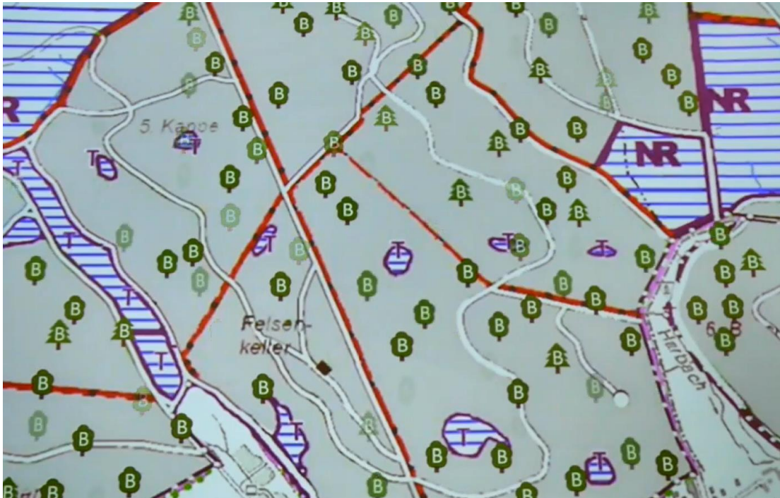
Abb. 1: Auszug aus der Naturschutzkarte des Forstbetriebs Ebrach. Trittsteine (T) vernetzen Naturwaldreservate (NR) untereinander und mit den temporär immer wieder nachwachsenden Biotopbäumen (B) im extensiv bewirtschafteten Wald. (Mergner, Ulrich: Das Trittsteinkonzept, S. 62) Biotopbäume, weisen eine oder mehrere Habitatstrukturen auf.