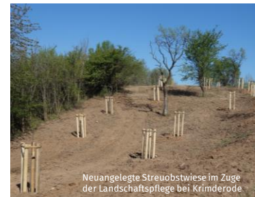
Neuangelegte Streuobstwiese im Zuge der Landschaftspflege bei Krimmerode