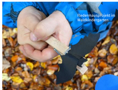
Fledermausprojekt im Waldkindergarten