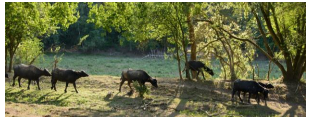
Auf passenden Standorten stellt auch Rinderbeweidung eine geeignete landschaftspflegerische Maßnahme dar.

Im vergangenen Jahr konnte bereits ein kleines Netzwerk an engagierten Weidetierhalterinnen und Weidetierhaltern aufgebaut werden, welches langfristig erweitert und zu einer festen Kontakt- und Austauschmöglichkeit ausgebaut werden soll, unter anderem durch die Etablierung eines Weidetierhalter-Stammtisches. Austausch, Beratung und Qualifizierung von Weidetierhaltenden sind wichtige Elemente bei der Absicherung einer dauerhaften Landschaftspflege durch Beweidung als ein wichtiges und langfristig anvisiertes Projektziel.