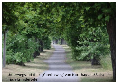
Unterwegs auf dem „Goetheweg“ von Nordhausen/Salza nach Krimderode