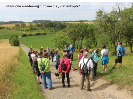
Botanische Wanderung rund um die „Pffenköpfe“