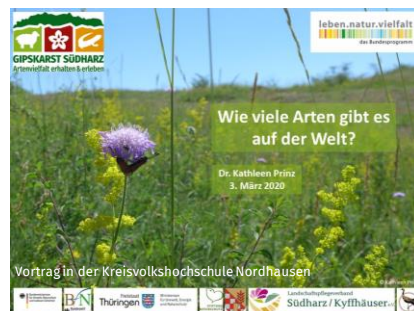
Wie viele Arten gibt es auf der Welt?