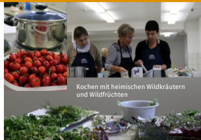
Kochen mit heimischen Wildkräutern und Wildfrüchten