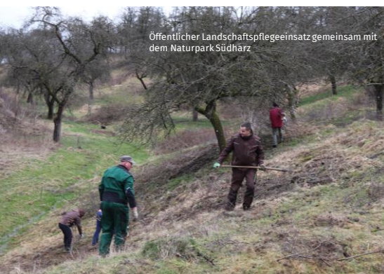
Öffentlicher Landschaftspflegeinsatz gemeinsam mit dem Naturpark Südharz