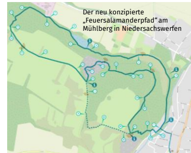
Der neu konzipierte „Feuersalamanderpfad“ am Mühlberg in Niedersachswerfen