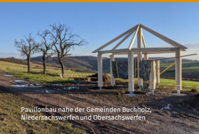
Pavillonbau nahe der Gemeinden Buchholz, Niedersachswerfen und Obersachswerfen