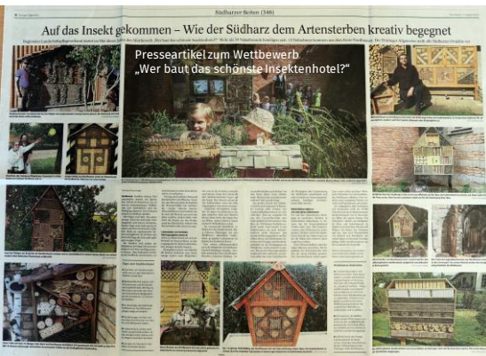
Auf das Insekt gekommen – Wie der Südharz dem Artensterben kreativ begegnet