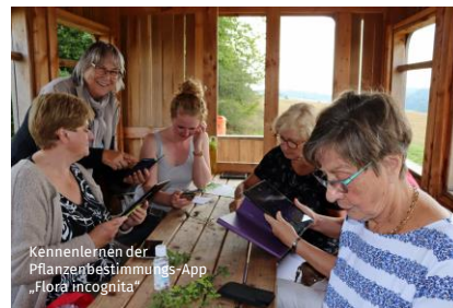
Kenntlernen der Pflanzenbestimmungs-App „Flora incognita“