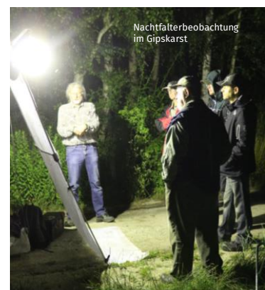
Nachtfalterbeobachtung im Gipskarst