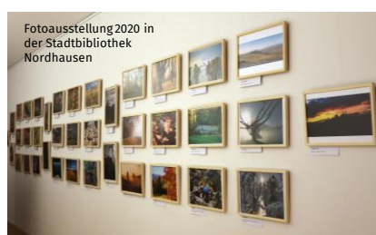
Fotoausstellung 2020 in der Stadtbibliothek Nordhausen