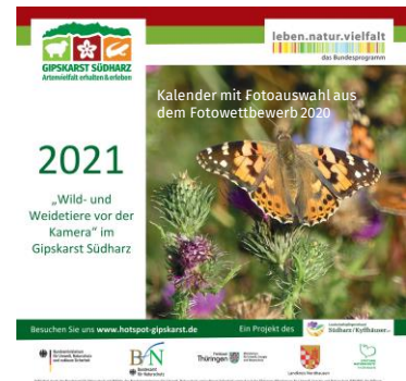
Kalender mit Fotoauswahl aus dem Fotowettbewerb 2020