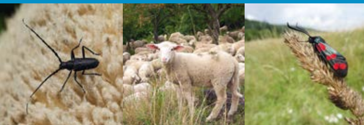
Von links nach rechts: Transport von Tieren wie Moschusbock ( Aromia moschata ) und zahlreichen Samen im Schaffell, Sechsfleck-Widderchen ( Zygaena filipendulae )

Zentrales Ziel des Projekts „ Schaf schafft Landschaft “ ist es, den Fortbestand der Schafhaltung und damit die Pflege wertvoller Grünlandlebensräume im Projektgebiet langfristig zu sichern. Dafür arbeiten wir von Anfang an Hand in Hand mit den ansässigen Schäfereibetrieben und Partnern der Region.