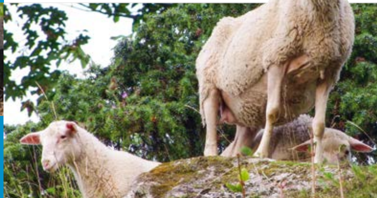
Schafe erreichen und pflegen auch schwer zugängliche Standorte wie in der Karstlandschaft Hielöcher im Meißnervorland

Wertvolle Flächen wie Halbtrockenrasen sind oft schwer zugänglich , dadurch ist die Pflege solcher Flächen häufig nur mit Schafen möglich. Ohne eine Nutzung drohen die Flächen aber zu verbuschen. Die biologische Vielfalt geht somit verloren.