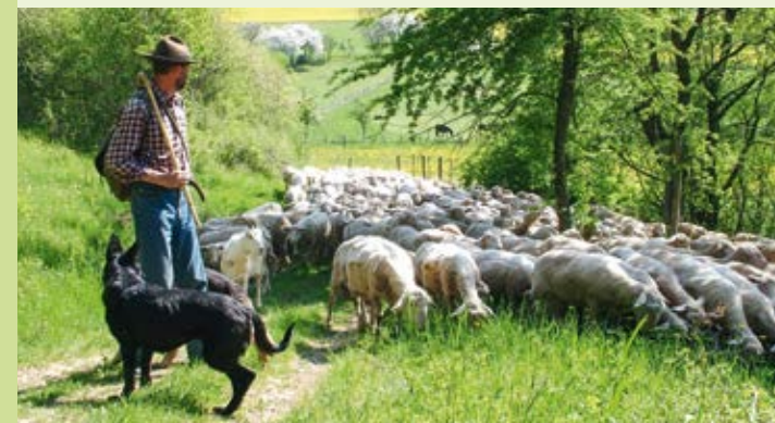
Gemeinsam unterwegs, um unsere Biodiversität zu erhalten: Schafe und Schäfer

Das Projekt setzt auf verringerte Arbeitsbelastung der Betriebe und beteiligt sich aktiv am politischen Diskurs, um den Fortbestand der Schäfereien langfristig zu sichern. Dazu sind verschiedene Maßnahmen angesetzt: