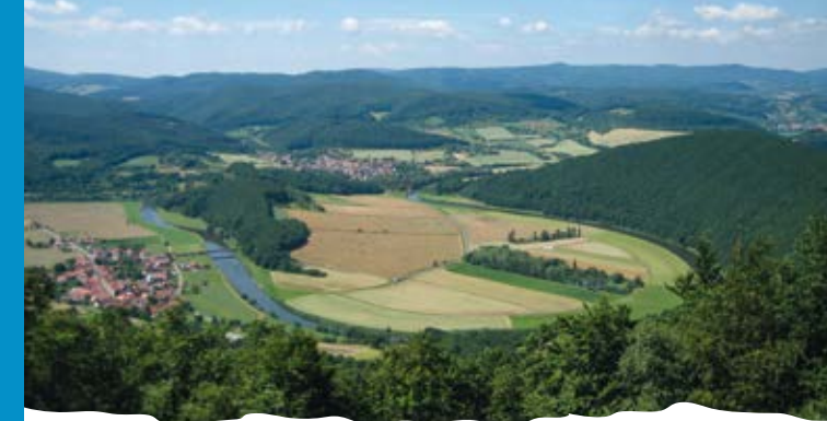
Blick auf die Werraschleife im Hotspot 17

Das Projekt „Schaf schafft Landschaft“ ist im Oktober 2019 gestartet und läuft über sechs Jahre. Die Projektleitung und die wissenschaftliche Begleitung übernimmt die Universität Kassel. Projektpartner sind der Werra-Meißner-Kreis und der Geo-Naturpark Frau-Holle-Land.