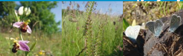
Von links nach rechts: Bienenragwurz ( Ophrys apifera ), Kammgras ( Cynosurus cristatus ), Hauhechel-Bläulinge auf Weidetierkot ( Polyommatus icarus )

Das Projektgebiet befindet sich im „ Hotspot 17 – Werratal mit Hohem Meißner und Kaufunger Wald“, dessen Lage und Besonderheiten Sie auf der Rückseite des Flyers finden. Wertvolle Lebensräume mit einer hohen Artenvielfalt werden im Projektgebiet durch Schafbeweidung gepflegt und erhalten. Doch durch zunehmende Herausforderungen für die Betriebe ist die Anzahl der Schafe und Schafhalter rückläufig.